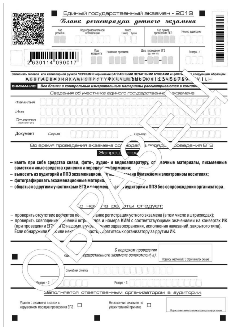
Рис 17. Бланк регистрации устного экзамена

Бланк регистрации устного экзамена заполняется так же, как обычный бланк регистрации (см. п. 3.3). В поле «Номер аудитории» указывается номер аудитории проведения устного экзамена. Служебные поля «Резерв-1», «Резерв-2» и «Резерв-3» не заполняются.