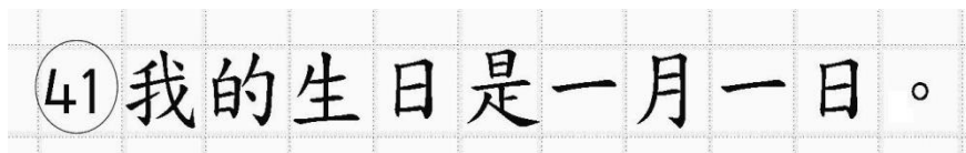
Рис.14. Образец написания иероглифических знаков

Односторонний бланк ответов № 2 (лист 1 и лист 2) предназначен для записи ответов на задания с развернутым ответом по китайскому языку (строго в соответствии с требованиями инструкции к КИМ и к отдельным заданиям КИМ). Каждый иероглифический знак и каждый знак препинания следует писать внутри отдельной клетки области ответов бланка ответов №2 (дополнительного бланка ответов №2) (рис. 14).