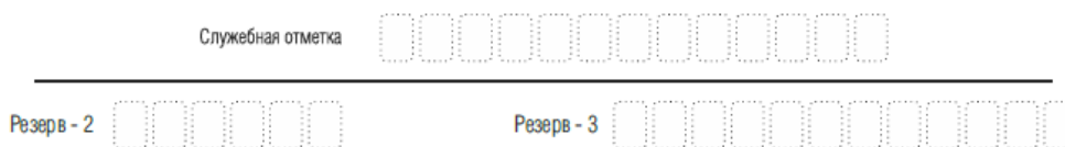
Рис. 5. Поля для служебного использования

Поля для служебного использования «Служебная отметка», «Резерв-2» и «Резерв-3» не заполняются.